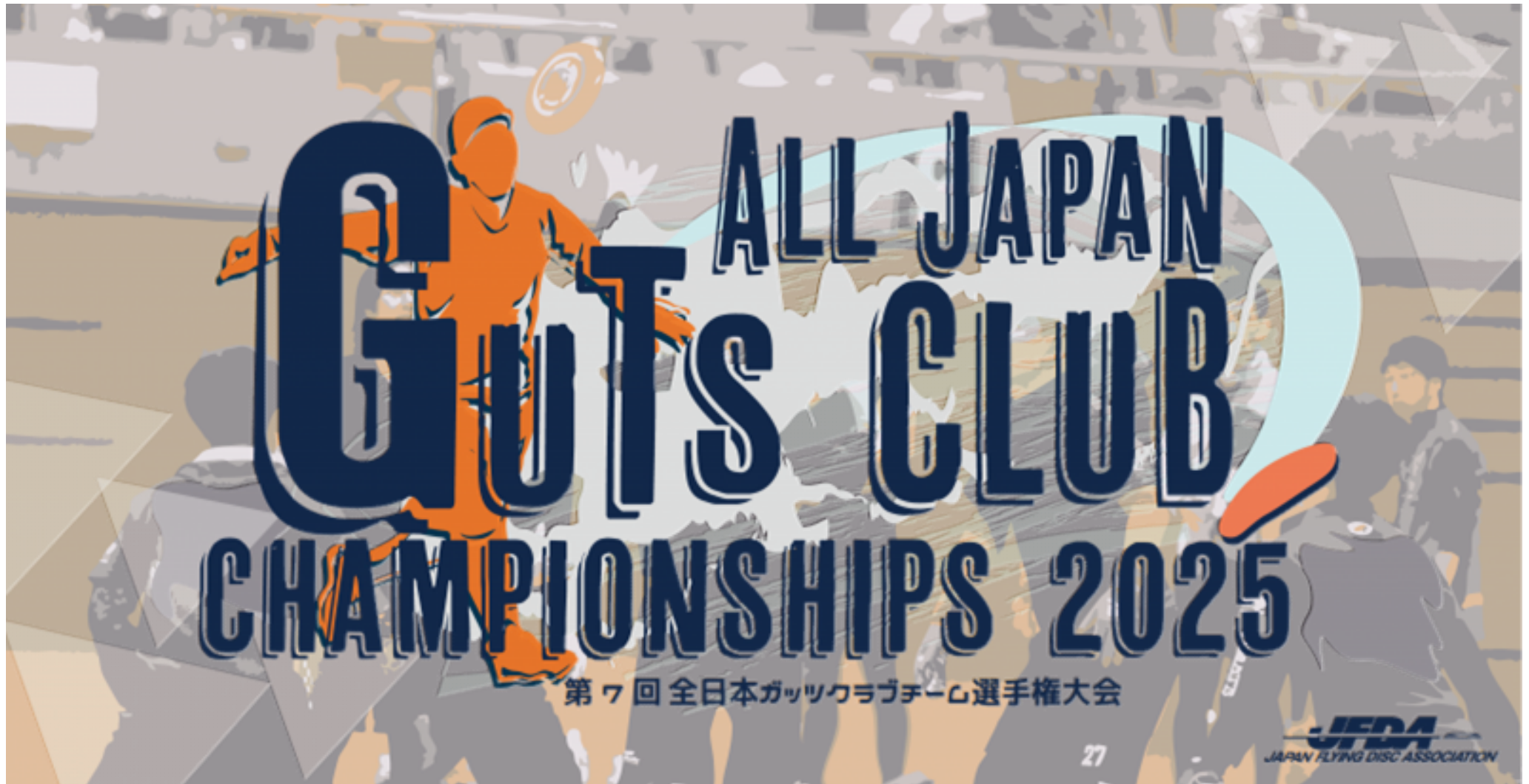
第7回全日本ガッツクラブチーム選手権大会 最終結果