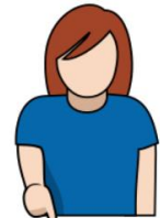
8. ディスクダウン 「ダウン」 人差し指と片腕を下方 45度伸ばす。