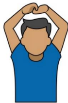
18. (その他の)中断 「インジャリー」「テクニカル」 頭上で両手を握り、 腕を曲げる