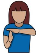
16. タイムアウト 「タイムアウト」 手もしくはディスクで Tの字を作る。