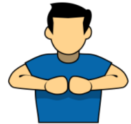
4. コンテスト 「コンテスト」 胸の前で両手を握り合わせ、 肘を左右に張る。