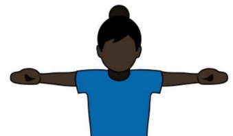
12. マーカーインフラクション 「ファストカウント」「ストラドル」 「ディスクスペース」「ラッピング」 「ダブルチーム」「ビジョン」 両腕を左右に開き、 手のひらを前に向ける。