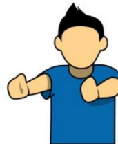
23. 誰がコールしたか 「コールドバイオフENS」 (ディフェンス) コールをしたチームが守っている エンドゾーンに両手を向ける。