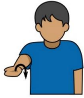
13. ターンオーバー 「ターンオーバー」 右手を体の前に伸ばし、 掌を上に向けた後、 下に向ける。