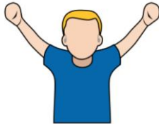
2. バイオレーション 「バイオレーション」 頭の上で両腕をVの字にする 手は握る。