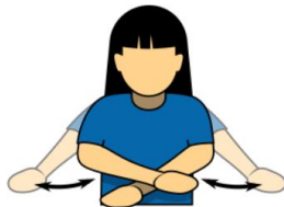
6. リトラクテッド/プレイオン 「コールの撤回」/「プレイ続行」 両腕を体の前で下向きに交差し、 その後を開く。