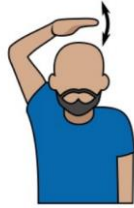
14. タイム・バイオレーション 「ストールアウト」 「バイオレーション」 掌を開き頭を軽く叩く。