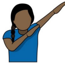
22. マッチポイント 「マッチポイント」 掌を下に向け、両手を左上に 上げる。