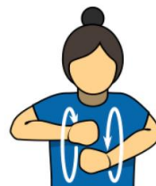
11. トラベル 「トラベル」 手を握り、身体の前で 両手を回す。