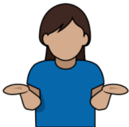
5. アクセプト 「コールを認める」 掌を上にして、 両腕を前に差し出す。