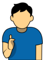
9. ディスクアップ 「アップ」 片方の肘を曲げ、 人差し指を上に向ける。