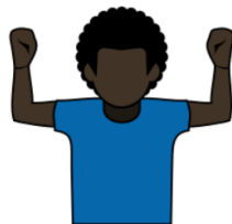
10. ピック 「ピック」 肘を曲げ、両腕を上げる。 手は握る。