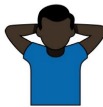
19. 男性 4 名 女性 3 名 「4 メン」 両手を頭の後ろで合わせ、 肘を張る。