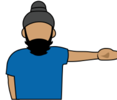
7. インバウンズ/アウト・オブ・バウンズ 「イン」「アウト」 全ての指と片腕を伸ばし、 インまたはアウトの方向を指し示す。