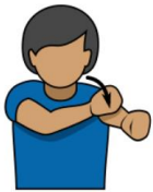
1.ファール 「ファール」 片方の腕を前に伸ばし、 もう一方の腕で叩く。