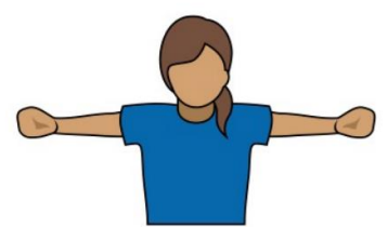
20. 女性 4 名 男性 3 名 「4 ウイメン」 両腕を横に広げる。 手は握る。