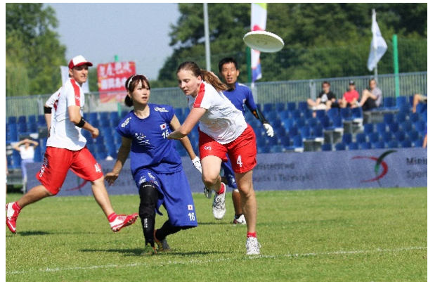
フライングディスク競技の代表種目「アルティメット」

本協定は、国内フライングディスク競技統括団体である日本フライングディスク協会と大手建設コンサルタント企業であるパシフィックコンサルタンツが、それぞれが持つ知見やネットワークを相互に活用し、今後、フライングディスク競技を通じた地方創生の実現に向けて、その可能性や方策を検討し、相互の発展に資することを目的としています。