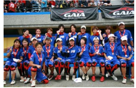
準優勝。1992年の日本（宇都宮）開催

より、2度目の国別対抗での優勝を目指した。予選では、アメリカ戦を1点差で勝ち、予選全勝で決勝トーナメントへ。決勝戦では前半日本がリードするものの、後半に逆転を許し惜しくも敗れたが、見事堂々の準優勝を果たした。